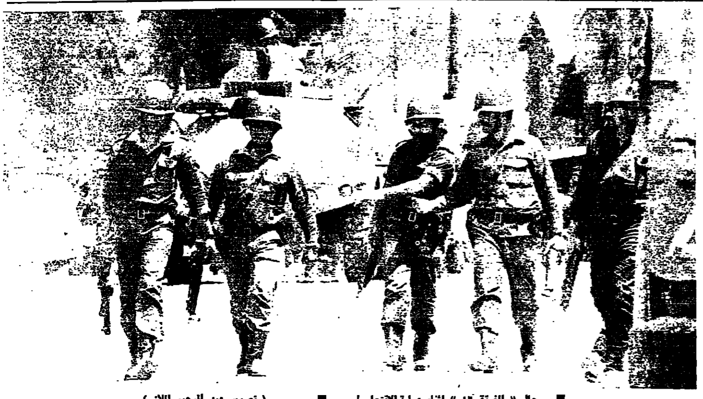
رجال « الفرقة ١٦ » أثناء عملية الانتماء امس